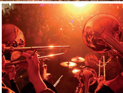
Neue Fasnacht-OKs übernehmen