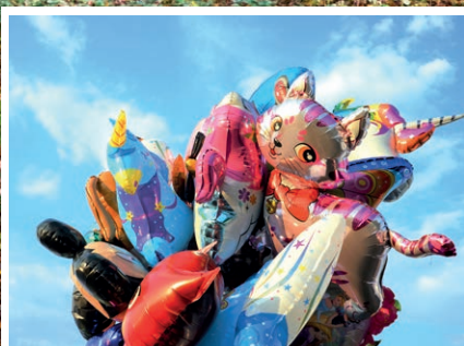
Jahrmart und Chilbi zurück im Dorfkern