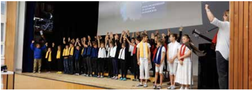
Klima-Event in St. Gallenkappel

Zur Belohnung für den enormen Einsatz durften die beiden Klassen am Dienstag, 17. November nach Bern reisen zum Klima-Fest im Kursaal. Zusammen mit 1'500 anderen Kindern trafen sie den Moderator Ueli Schmezer und den Beatboxer Knackeboul. Das absolute Highlight aber war, als je ein Kind von jeder Klasse das Klima-Energiepioniere-Diplom aus den Händen von Bertrand Piccard in Empfang nehmen durfte. Dieser Tag war einmalig und wird allen Beteiligten in bester Erinnerung bleiben.