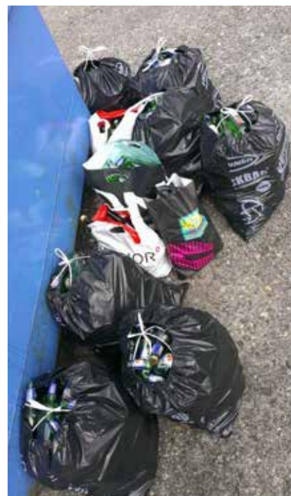
Unerlaubte Abfalldeponien beim Dorftreff Eschenbach