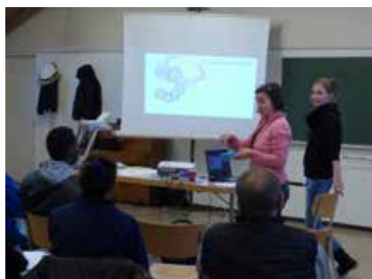
Freiwillige Helfer beim «Unterrichten»

Anlässlich einer Lektion im Dezember wurden aber auch die deutschen Zahlen gelernt und beispielsweise spielerisch aufgezeigt, wieviel verschiedene Produkte in der Schweiz kosten. Was sonst Kinder in der Schweiz schon ganz früh können, zum Beispiel bis zehn zählen, wird mit viel Geduld den Asylbe-