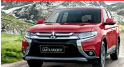
New Outlander Ab Fr. 24 999.-