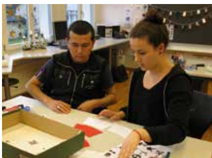
Eine Schülerin und ein Asylbewerber beim Basteln und Aufräumen der Küche gut mit.

ler der Klasse S2c betreut. Die Stimmung war in allen Gruppen sehr gut. Die Sportgruppe zeigte sich aktiv und motiviert und die Teilnehmer freuten sich über jeden Treffer. In der Bastelgruppe wurde sehr genau und kreativ gearbeitet und in der Backgruppe entstanden wunderschöne Grittbänze, die die Asylanten mit viel Fantasie verzierten. Auch halfen sie beim Abwaschen