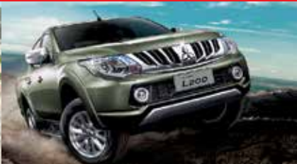
All-New L200 Ab Fr. 27 499.-