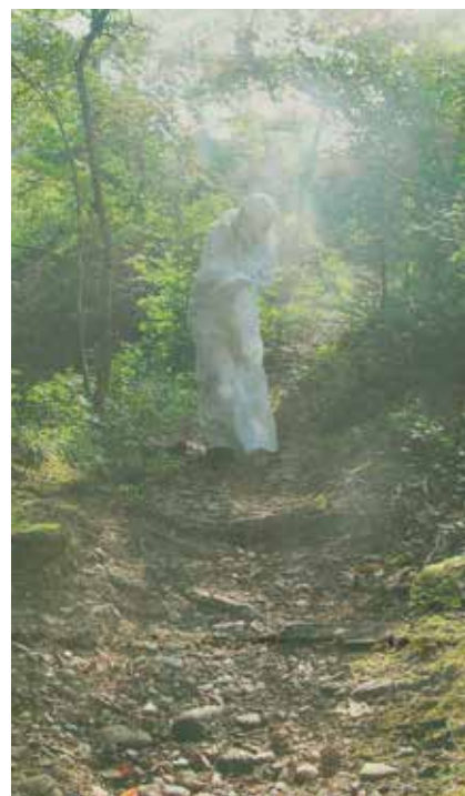
«Stichwiibli» oder «Spinnfräuli» beim Chälenstich

Die Kulturkommission und der Gemeinderat freuen sich auf viele Teilnehmerinnen und Teilnehmer!