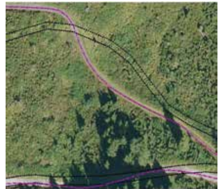
Nachführung von Strassen und Wegen