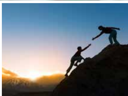
Freiwillige Helfer gesucht