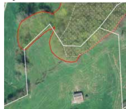
Abgleich der Walddefinition