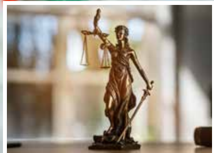
Urnenabstimmung vom 10. Februar 2019