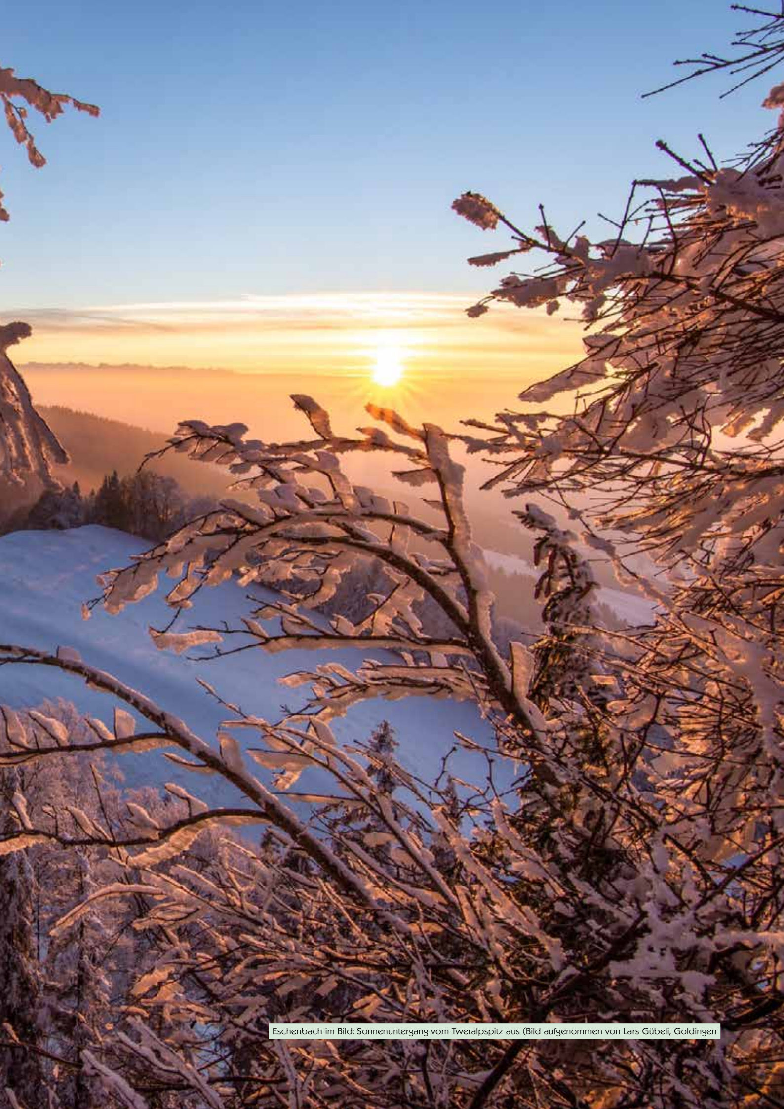
Eschenbach im Bild: Sonnenuntergang vom Tweralpspitz aus