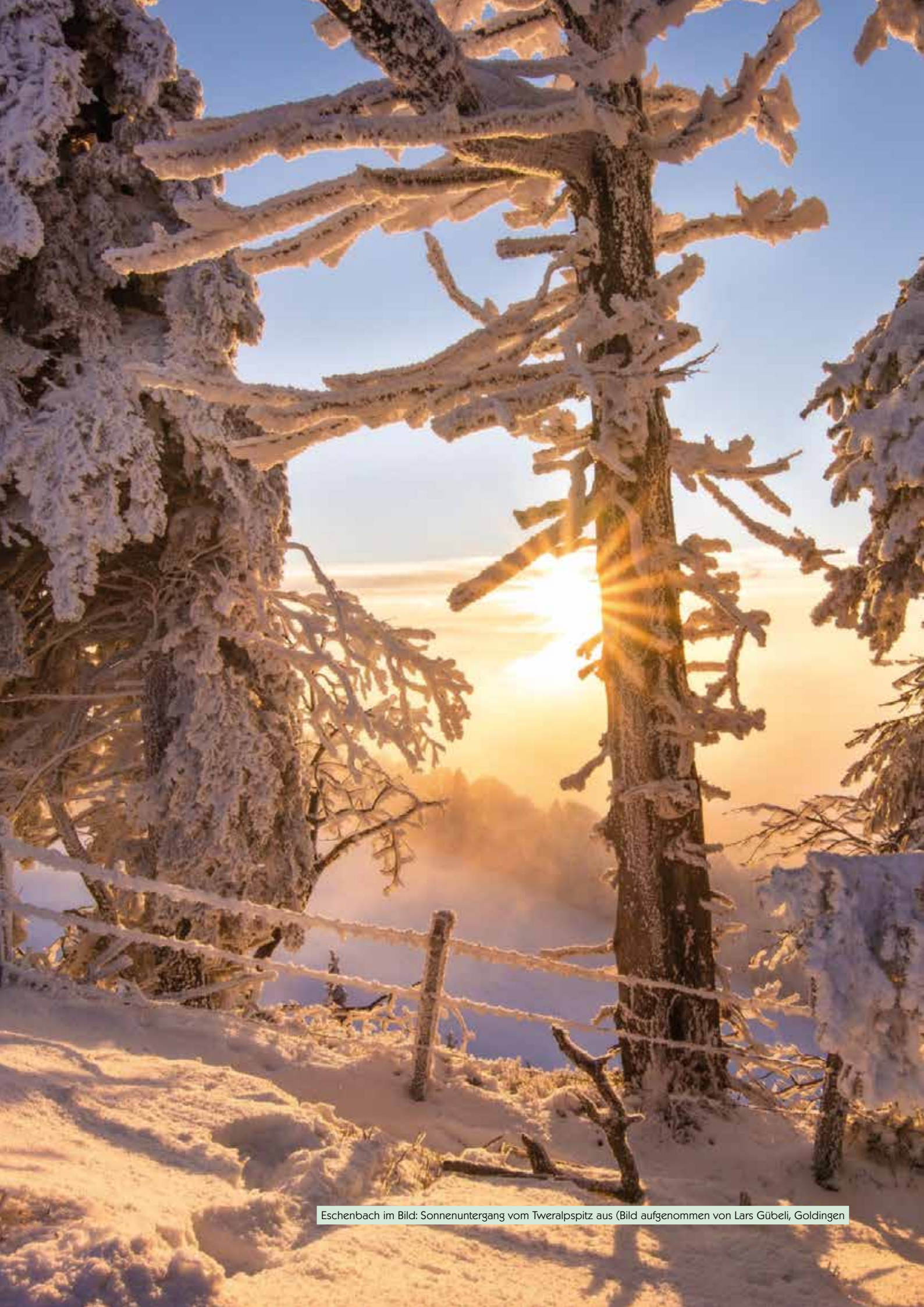
Eschenbach im Bild: Sonnenuntergang vom Tweralpispitz aus