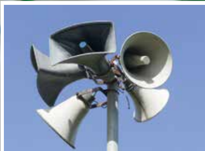
Sirenentest am 6. Februar 2019