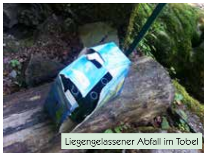
Liegengelassener Abfall im Tobel

niessen. Umso wichtiger ist es aber, diesen wunderbaren Ort zu schützen und zu pflegen.