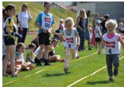
Impressionen vom Sporttag in St. Gallenkappel