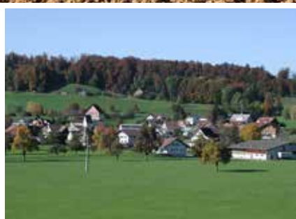
Strassensperrung Dorfstrasse Bürg

Neue Lernende in Verwaltung und Werkdienst Ruhezeiten