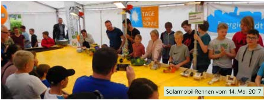
Solarmobil-Rennen vom 14. Mai 2017