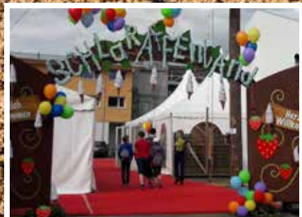
Rückblick aufs «Schlaraffenland»