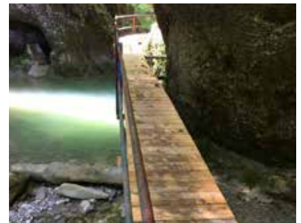
Wegsanierung Neuhüsler Tobel