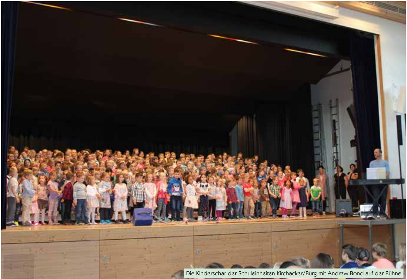
Die Kinderschar der Schuleinheiten Kirchacker/Bürg mit Andrew Bond auf der Bühne