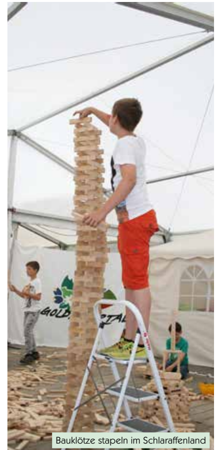
Bauklötze stapeln im Schlaraffenland