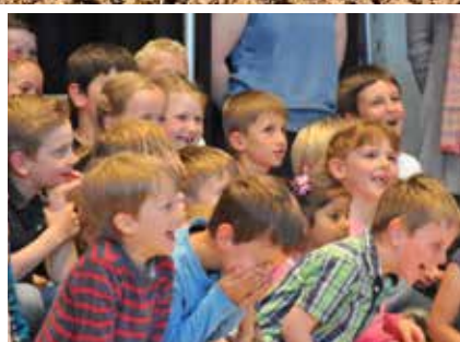
Allerlei aus der Schule