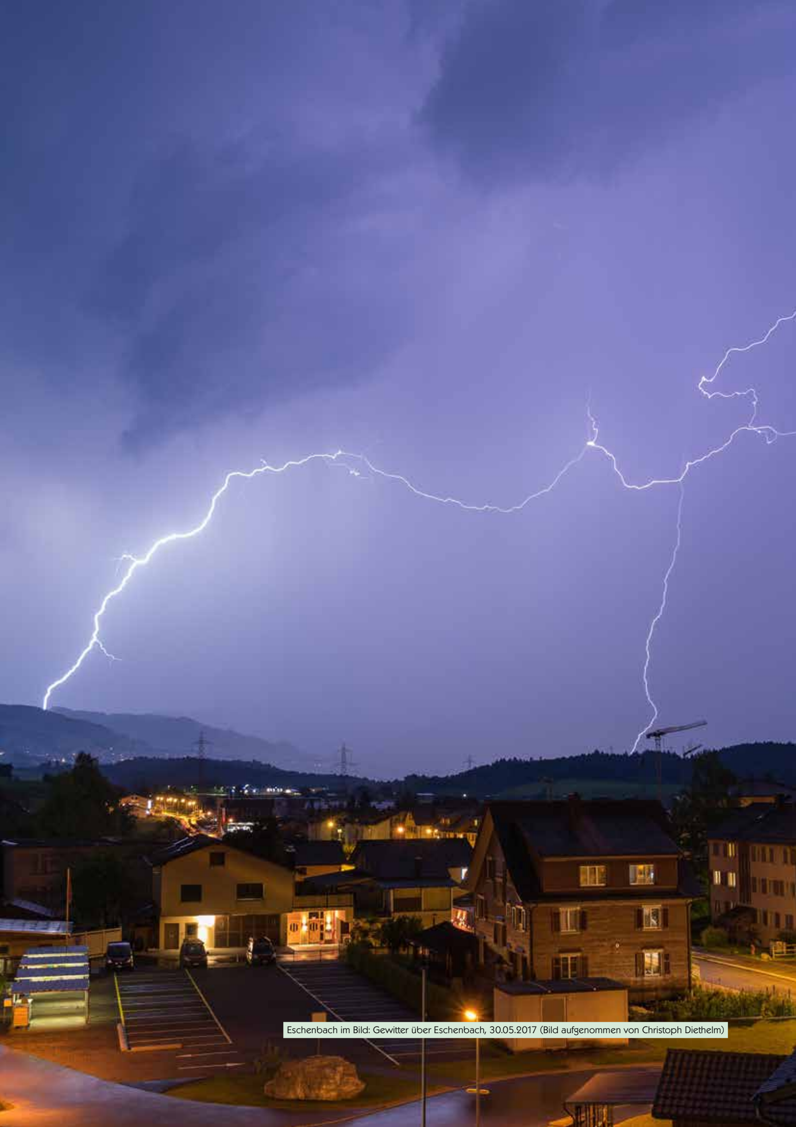
Eschenbach im Bild: Gewitter über Eschenbach, 30.05.2017