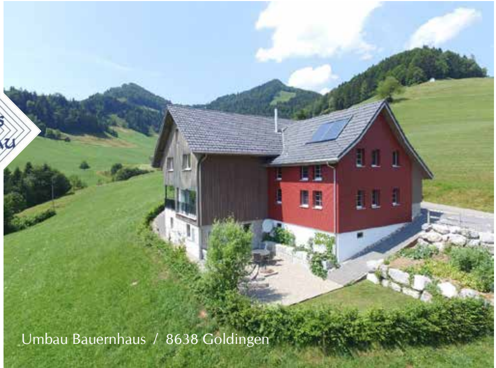
Umbau Bauernhaus / 8638 Goldingen

Landhaus-Bau AG / Obermatten 13 / 8735 Rüeterswil / 055 284 50 70 / info@landhaus-bau.ch Architekturbüro / Neubauten / Umbauten / www.landhaus-bau.ch