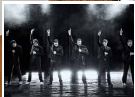
A-live in Eschenbach