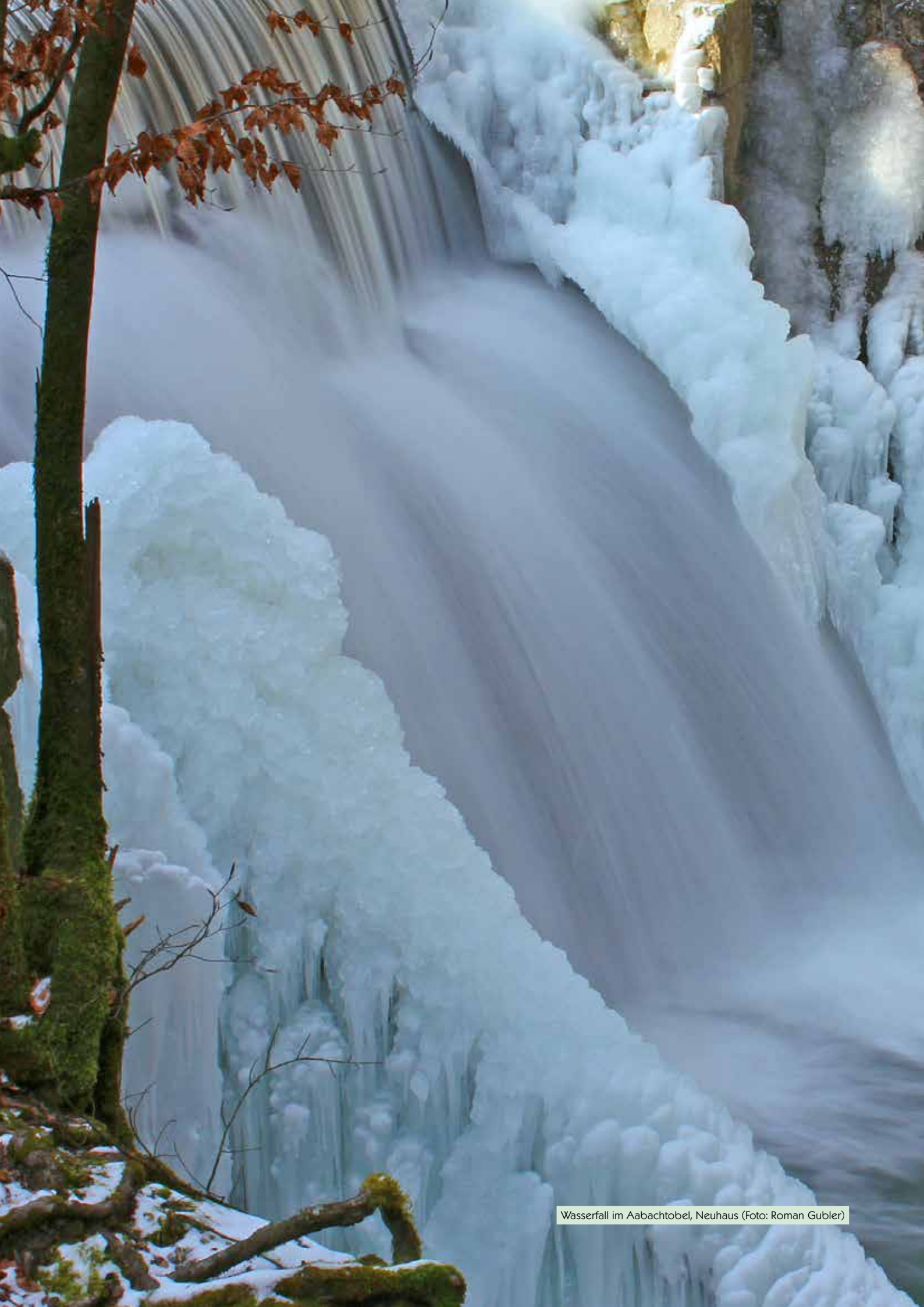
Wasserfall im Aabachtobel, Neuhaus