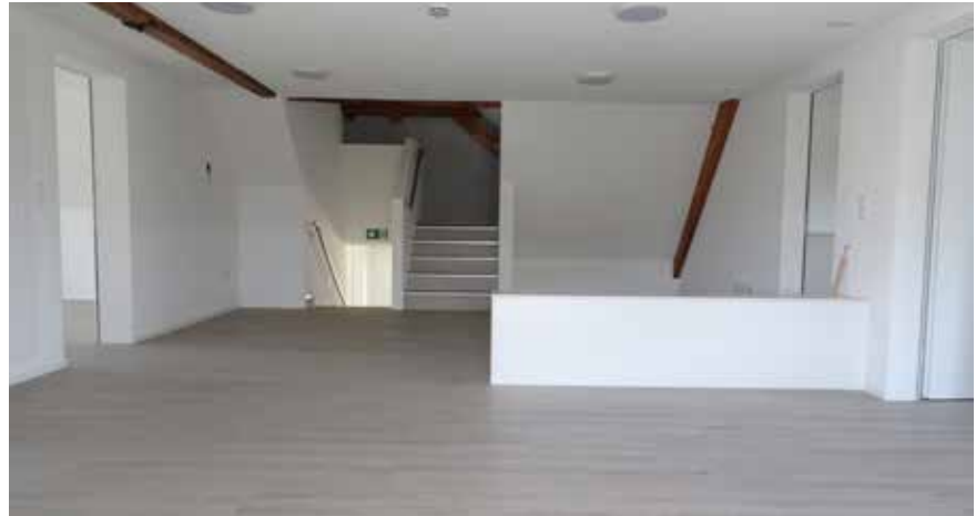
Ausgebauter Dachstock der Kindertagesstätte Nepomuk

Der Umbau des alten Gemeindehauses Eschenbach an der Rössligass 5 für die Bedürfnisse der Kindertagesstätte Nepomuk wurde abgeschlossen. Nachdem nun alle Unternehmer ihre Rechnungen zugestellt haben, liegt auch die Schlussabrechnung der PS Planungsbüro Schubiger AG vor. Im August 2014 stimmte der Gemeinderat einem Kredit auf der Grundlage von angestellten Kostenschätzungen von Fr. 440'000.- zu. Aufgrund nicht vorgesehener und zusätzlicher Massnahmen, welche bei einem Umbau nicht ungewöhnlich sind, wurde die Investitionssumme auf Fr. 590'000.- erhöht (Eschenbach aktuell berichtete).