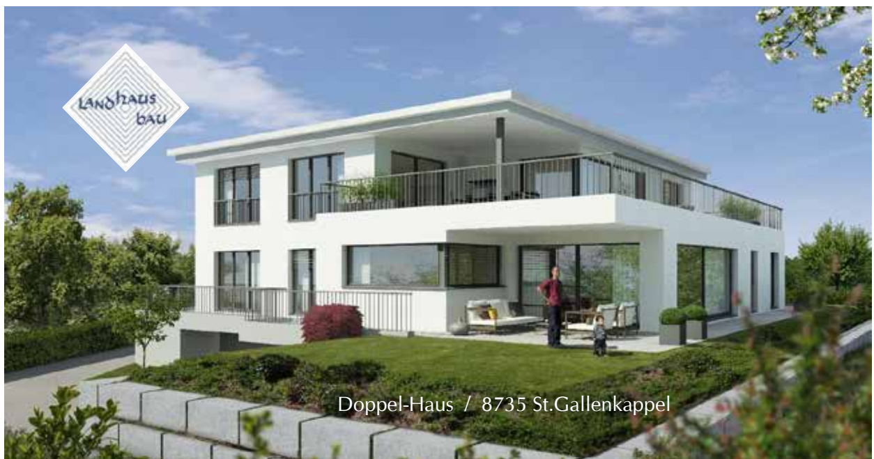
Doppel-Haus / 8735 St.Gallenkappel

Landhaus-Bau AG / Obermatten 13 / 8735 Rüeterswil / 055 284 50 70 / info@landhaus-bau.ch Architekturbüro / Neubauten / Umbauten / www.landhaus-bau.ch