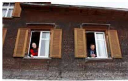
Das Wirtepaar des Restaurant Alpenblick wartet gespannt auf die Wanderschar