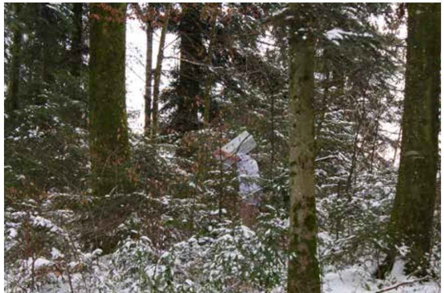
Das Lohstei-Mannli treibt im Weiherwald sein Unwesen...

Beim «Güxhalt» im Restaurant Alpenblick konnten sich die Wanderer aufwärmen.