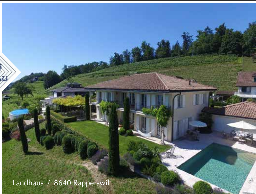
Landhaus / 8640 Rapperswil

Landhaus-Bau AG / Obermatten 13 / 8735 Rüeterswil / 055 284 50 70 / info@landhaus-bau.ch Architekturbüro / Neubauten / Umbauten / www.landhaus-bau.ch