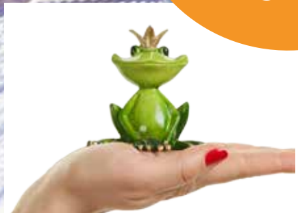
Der Froschkönig im Dorftreff