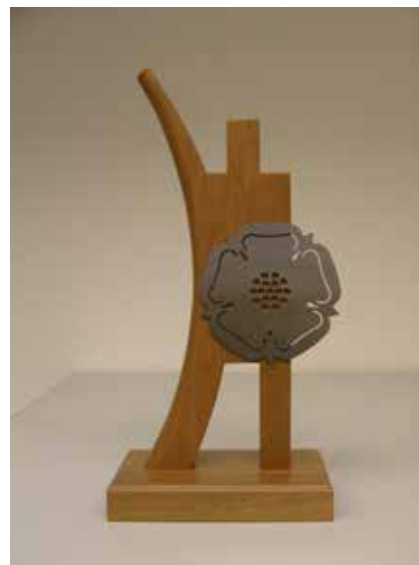
«Eschenbach Award» bis 2012