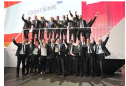
Die Baumann Federn AG hat allen Grund zum Jubeln

Dass in all den Jahren die Familie und die Tradition zentrale Werte des Unternehmens blieben, die sich in seiner regionalen Verankerung widerspiegeln, hat uns überzeugt.»