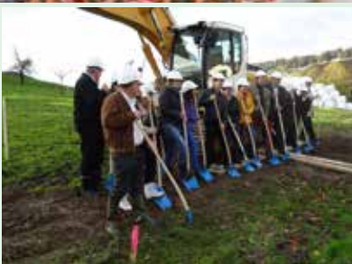
Spatenstich Erschliessung Bless-Twirren