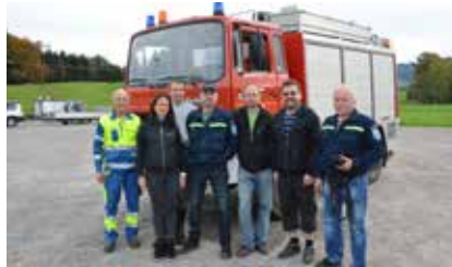
St. Gallenkappeler und tschechische Feuerwehr

termühle erlernen und üben. Nachdem die Zollabfertigung in St. Gallen und St. Margrethen erledigt war und nach einer 12-stündigen und 820 km langen Fahrt durch Österreich, Deutschland und die tschechische Republik kamen die neuen Besitzer am Mittwochmorgen um 03.00 Uhr zu Hause im Riesengebirge, fast an der polnischen Grenze, ohne Zwischenfall an.