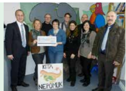
Projekt „Purzelbaum“ der Kita