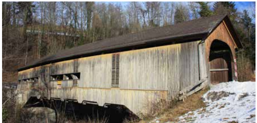
Holzbrücke über das Aabachtobel (erbaut 1830)

Mit der Bürgerversammlung der Politischen Gemeinde Eschenbach am 11. April 2013 wird das Projekt Gemeindevereinigung mit der letzten Amtshandlung des eigentlichen Vereinigungsprozesses abgeschlossen. Der neue Gemeinderat hat die vier Jahresrechnungen 2012 der politischen Gemeinden Eschenbach, Goldingen, und St. Gallenkappel sowie der Schulgemeinde Eschenbach-St. Gallenkappel-Goldingen (ESGO) genehmigt. Die neue Geschäftsprüfungskommission hat im Rahmen ihres gesetzlichen Auftrags diese vier Jahresrechnungen geprüft und erstattet der Bürgerschaft an der kommenden Bürgerversammlung ihre Berichte und Genehmigungsanträge. Ergänzt wird die Traktandenliste durch den Antrag des Gemeinderats über die Verwendung des Ertragsüberschusses 2012 der alten Gemeinde Eschenbach. Für die Beschlussfassung über all diese Geschäfte ist die Bürgerschaft der neuen Gemeinde Eschenbach zuständig. Aufgrund der besonderen Situation kommt